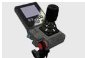
Steuereinheit mit Display und elektrischem Joystick.